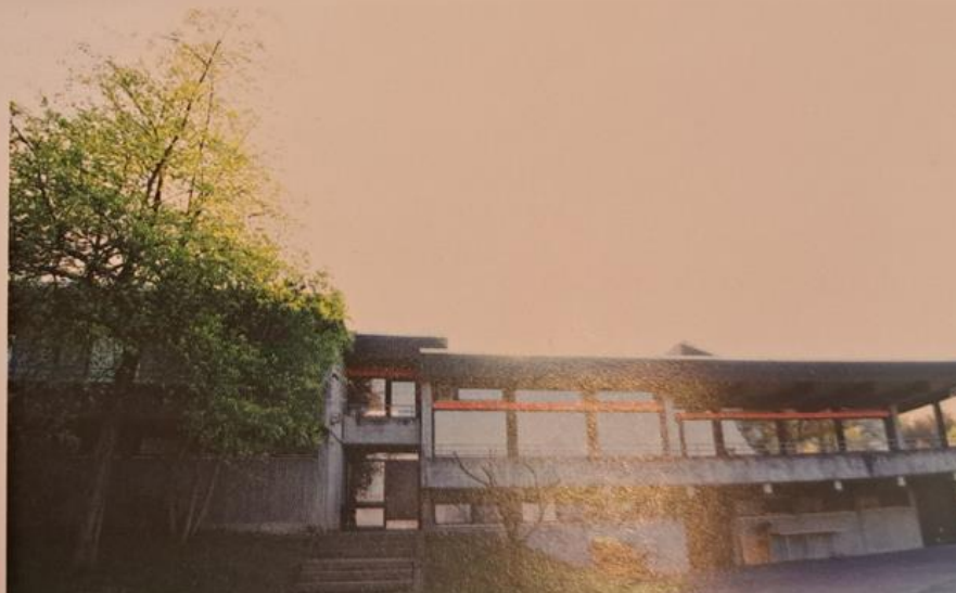
Aspen Gaststätte (eingeweiht 1975)

An diesem Tag wurde auch das Gau-Kinderturnfest veranstaltet.